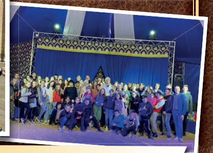
Sant'Antonio di Padova e il Circo!