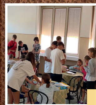
Attività' del Grest